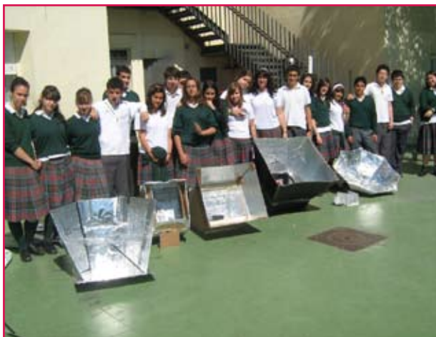
Grupo de Alumnos con las Cocinas Solares

Breve descripción: Se realizan varias presentaciones de la Fundación a los distintos claustros de los colegios de: Mater Purissima (Madrid), Hijas de Jesús (Coruña), Sagrado Corazón (Salamanca), Stella Maris (Almería) y Virgen de la Paz (Almería).